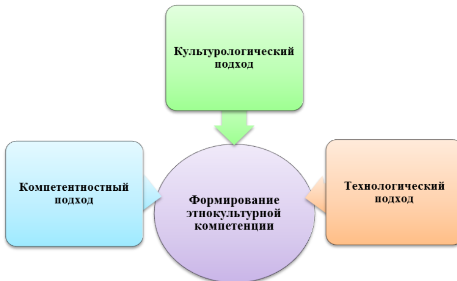
Рис.1. Система методологических подходов к предмету исследования.

Государственная ценность образования представляет собой моральный, экономический, интеллектуальный, научный, технический, духовно-культурный потенциал любого государства.