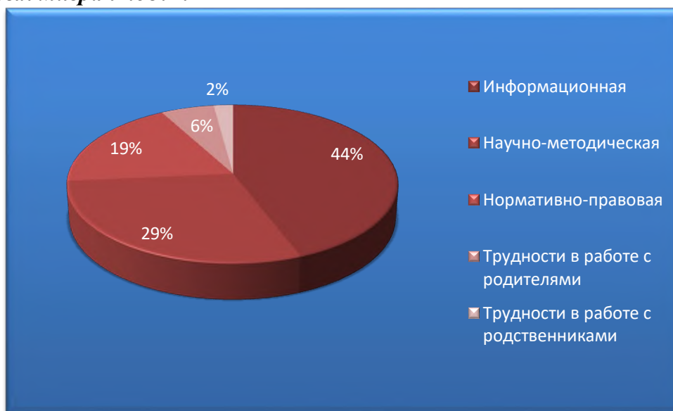
Рис. 3.1. - Оценка экспертами трудности, встречающиеся в процессе обучения и воспитания детей трудовых мигрантов (в % от числа опрошенных)

Далее в диаграмме 3.1 показаны ответы наших экспертов на вопрос: «Какие трудности часто встречаются в процессе обучения и воспитания детей трудовых мигрантов?» .