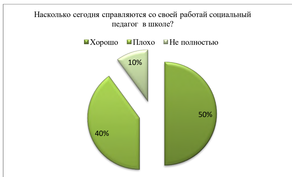
Рис. 2.1. Отношение экспертов к работе социальных работников, социальных педагогов в школе

Как правило, с детьми трудовых мигрантов в основном в сегодняшних условиях работают социальные работники, социальные педагоги, психологи. Одним из вопросов анкеты была посвящена к данной проблеме и вопрос звучал таким образом: «Справляется ли со своей работой социальный педагог, социальный работник в школе?» , Ответы распределились следующим образом. В основном по Чуйской области со своей работой и психолог, и социальный педагог справляется неплохо. Многие директора школ отвечали, что пока социальные педагоги, психологи, социальные работники недостаточно компетентны.