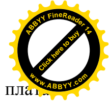
Таблица 2.3 - Среднемесячная номинальная заработная плата работников предприятий, организаций и учреждений Ошской области по видам экономической деятельности, (сомов)