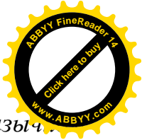
Табл. 1. Объективация национально-культурных смыслов в русскоязычном дискурсе с помощью полных заимствований из киргизского языка.