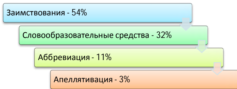
Рис. 1. Способы объективации нового смысла в русском языке Кыргызстана

критерии. Общий объем картотеки составил около 1500 единиц.