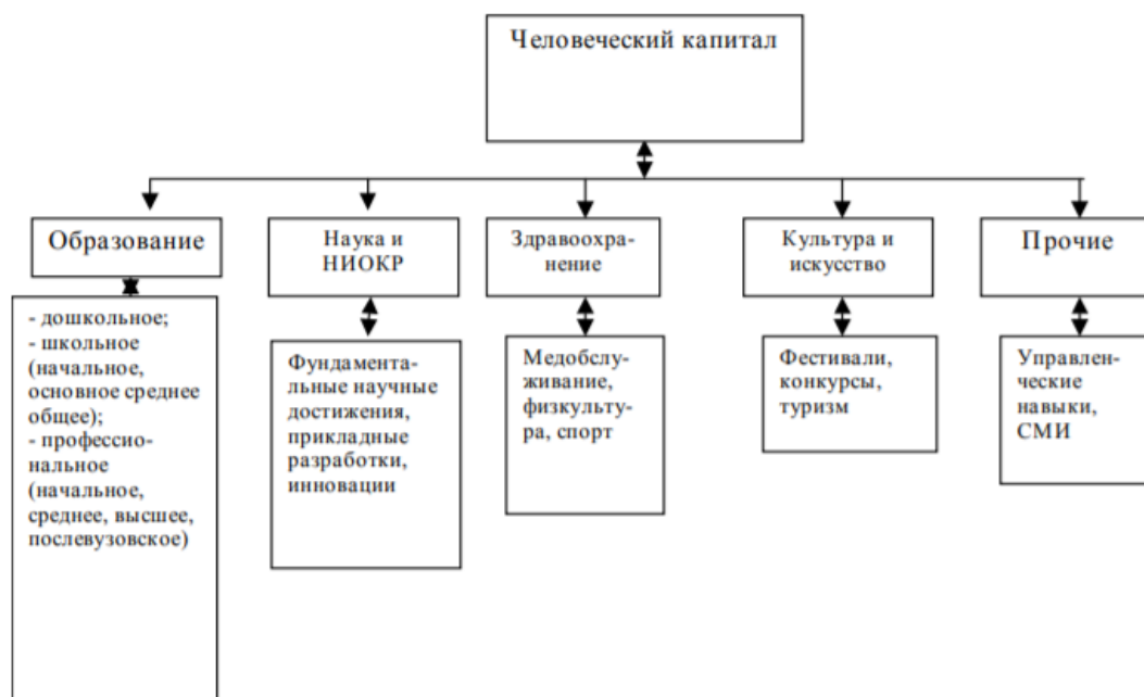
Рисунок 2. Системные элементы человеческого капитала*

На наш взгляд, качественная предварительная оценка суммы инвестиций в человеческий капитал и стимулирование его формирования и воспроизводства финансовыми методами является одним из способов создания оптимальных условий для экономического роста и повышения уровня благосостояния граждан. Механизмом формирования человеческого капитала считается инвестирование в людей - целенаправленные инвестиции в человека в виде материальной, денежной или другой форме. Данные затраты могут быть оценены как инвестиции с целью повышения производительности труда; Периодические расходы должны компенсировать их более высоким доходом в будущем. Чтобы понять направление инвестиций в человеческий капитал, необходимо рассмотреть их более подробно. (Рис. 2).