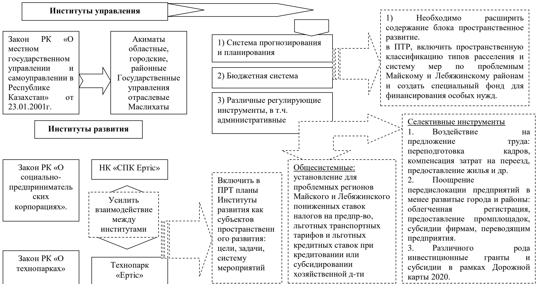
Рис. 5.1. Система государственного регулирования регионального развития в Казахстане

Примечание – составлено автором. Пунктиром обозначены блоки и стрелки с предложениями автора.