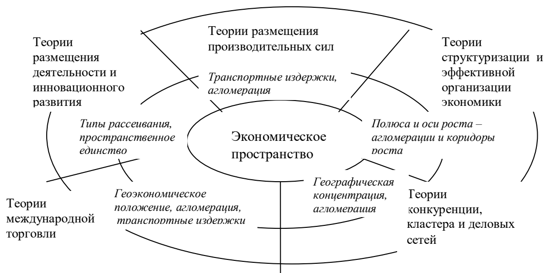
Рис.1.1. Использование характеристик экономического пространства в системе исходных понятий экономических теорий

Для выявления закономерностей экономического развития эти теории используют понятие агломерации, агломерационного эффекта, геоэкономического положения, транспортных издержек, полюсов и коридоров роста и т.д. (рис. 1.1)