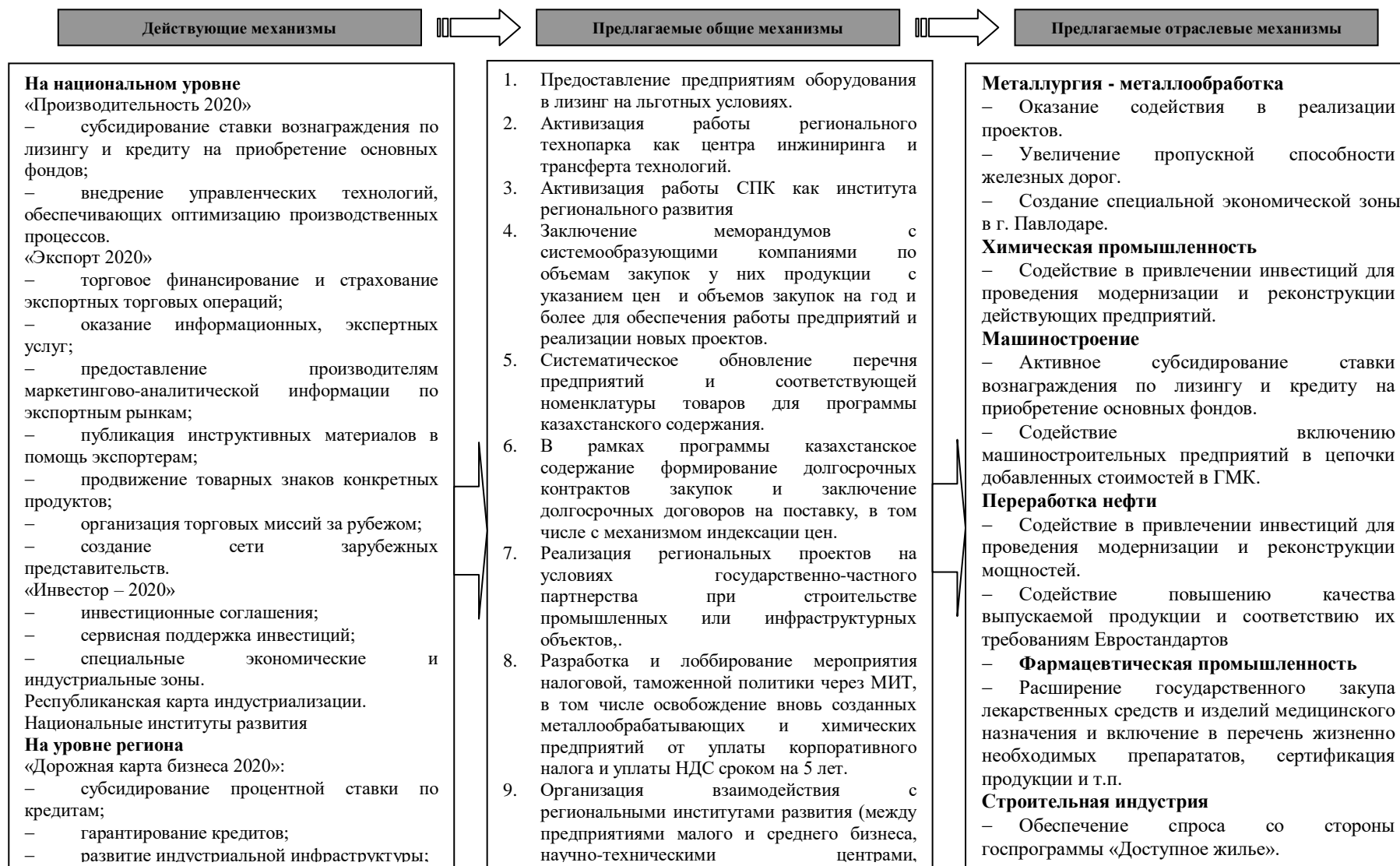
Рис. 5.2. Система механизмов сетевой организации инновационно-технологического развития региона