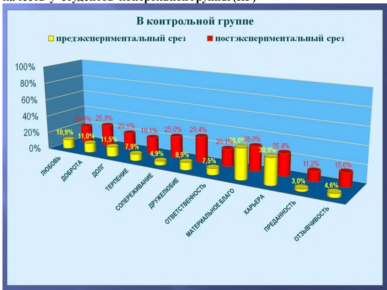
Диаграмма 1. Динамика формирования категорий нравственных качеств у студентов контрольной группы (КГ)