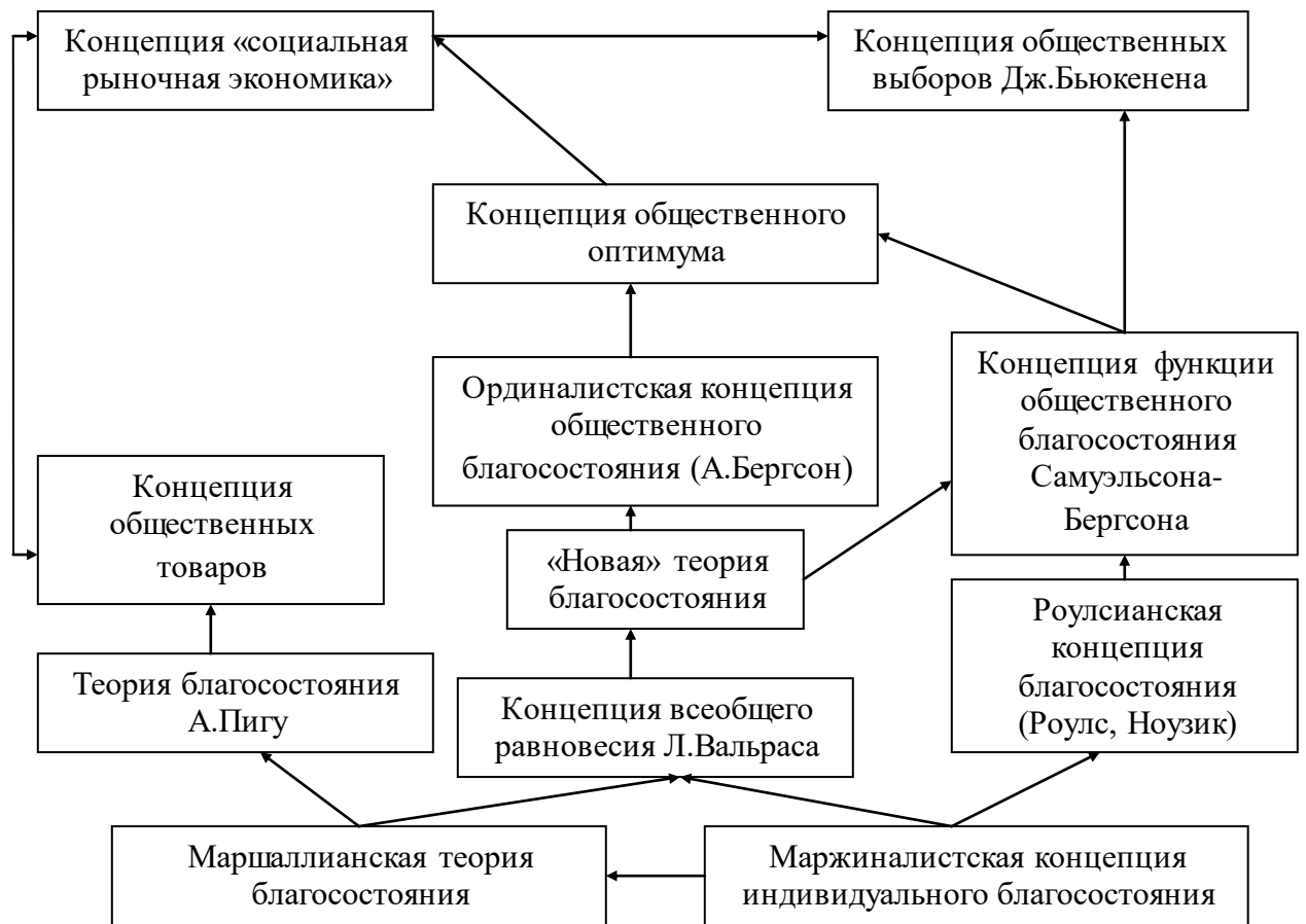
Схема 1 5 .

Представление о содержании понятия «благосостояние» исторически развивалось параллельно изменению процессов общественного воспроизводства. На вышеприведенной схеме мы можем увидеть эволюцию развития теорий благосостояния, которая построена по хронологическому принципу, и сгруппирована в зависимости от смены стадий общественного производства и исследовательских парадигм, а также с учетом подходов к трактовкам в определении категории благосостояние, которые были наиболее близки тем или иным ученым в определенный период времени.