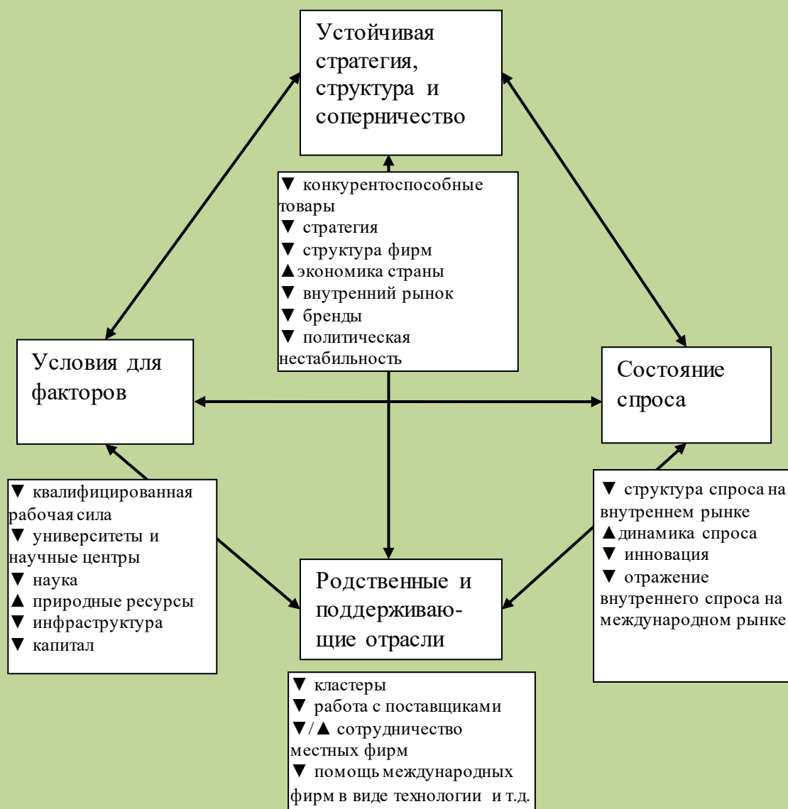
Рис. 2. Ромб конкурентоспособности для Кыргызстана*