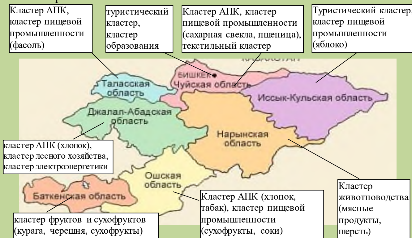
Рис. 4. Возможные кластеры в Кыргызстане*

фактор для привлечения инвесторов. Для потенциальных инвесторов наиболее важным требованием является политическая и экономическая стабильность.