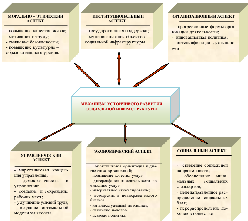
Схема 1. Механизм устойчивого развития социальной инфраструктуры 3

ленческих, организационных и морально-этических аспектов решений, воздействующих с позиций экономических интересов, что позволило нам сформулировать понятие механизма устойчивого развития социальной инфраструктуры (схема 1).