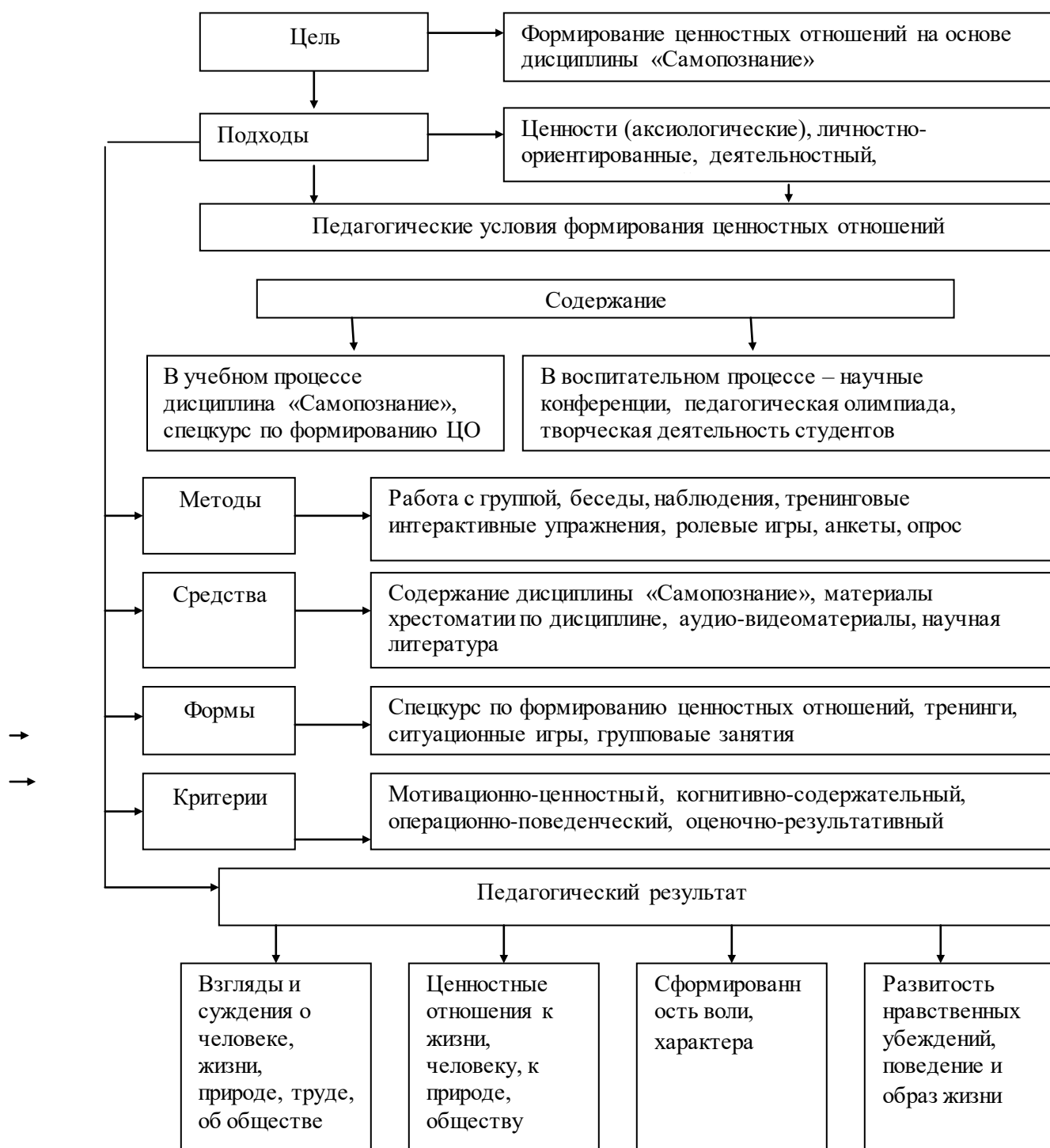
Рис. 2. Структурная модель формирования ценностных отношений студентов

Исходя из триединства целей: воспитания, развития, саморазвития, а также познавательного компонента мы разработали структурную модель формирования ценностных отношений студентов (Рисунок 3), а также критерии и показатели ценностных отношений студентов в соответствии с предлагаемой структурной моделью формирования ценностных отношений (Таблица 1).