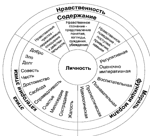
Рис. 1. Структура формирования нравственных ценностей младшего школьника.

В ходе теоретического исследования мы установили, что важным условием формирования нравственных ценностей у младших школьников средствами казахского фольклора являются казахские семейные традиции, которые выступают постоянно действующим регулятором отношений между людьми в семье и обществе.