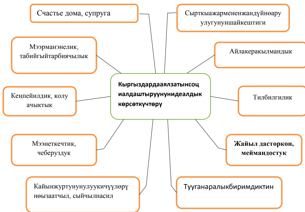
Рисунок 1. Идеальные показатели социализации женщин Кыргызстана

мировоззрении и интуиции. Хотя контент, который они классифицируют, многогранен, качественные характеристики, составляющие его, усиливают друг друга. В то же время можно трактовать природу явления одним словом, как в современных терминах в фольклорных текстах, живущих во фрагментарном фрагменте «теневого знания» (М. Полани), вплетенном в традиционные общественные отношения и традиционные культурные явления, происходит в виде афоризмов, императивов, эпитетов: “Үйдүн куту, акыреттик жар” (Благость дома – единственная навек жена), “сырткы ажар менен жан дүйнө аруулугунун шайкештиги” (гармония внешней красоты и чистоты внутреннего мира), “айлакер акылман, тил билгилик” (умница, умеющая со всеми найти общий язык), “кайын журтунун улуу кичүүлөрүнө ызаатчыл, сыйчыл насил” (почитающая старших и младших родичей мужа, гостеприимная), “тууган аралык биримдиктин данакери” (объединительница родственников), “кең пейилдик, колу ачыктык” (благородность и щедрость), “жайыл дасторкон, меймандостук” (гостеприимность), “мээрман энелик, табийгый тарбиячылык” (заботливая мать, воспитательница от природы), “мээнеткечтик, чебер уздук” (трудолюбие, мастера на все руки) (Рисунок 1).