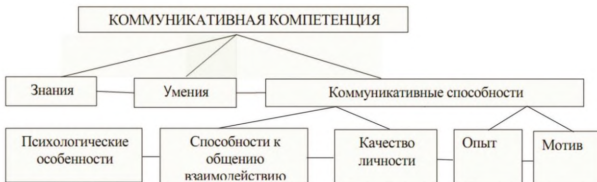
Рисунок 1. Структура коммуникативной компетенции.

Коммуникативные компетенции состоят из способностей, структура которых достаточно сложна и включают способности к общению и взаимодействию, качество личности, мотив (выраженное желание развивать способности, осуществлять общение и взаимодействие), психологические особенности и опыт общения и взаимодействия на иностранном языке.