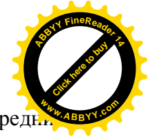
Таблица 1. Динамика отраслевой структуры действующих малых и средних предприятий.