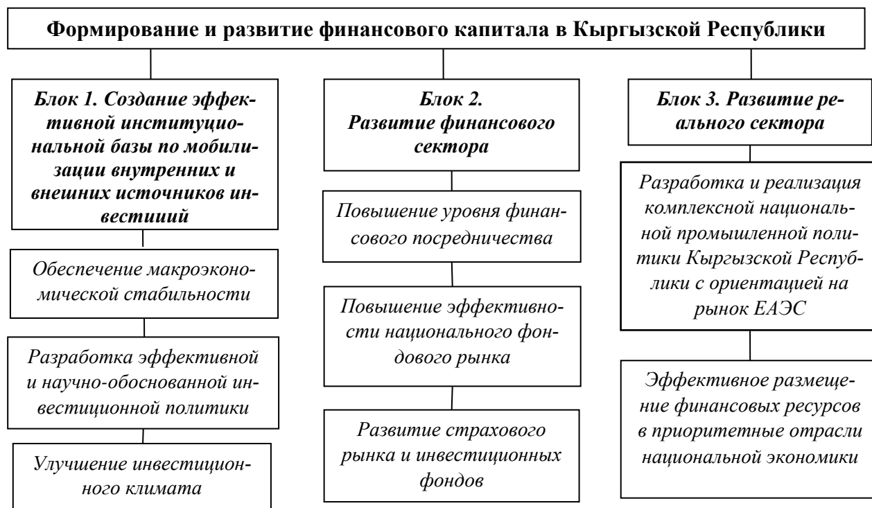
Схема 3.1 - Основные направления формирования и развития финансового капитала в Кыргызской Республике (составлено автором)

направления развития финансового капитала в Кыргызской Республике. Представленная схема 3.1 преследует цель создания необходимых условий для формирования и развития финансового капитала, соответствующей данному процессу инфраструктуры, а также накопления финансовых ресурсов, способных соответствовать потребностям реального сектора экономики на основе эффективного использования инвестиций.