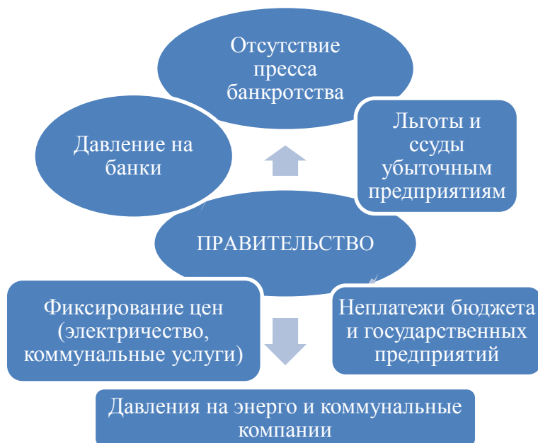
Рис. 4.2. Роль правительства в усугублении кризиса неплатежей

Неплатежеспособность имеет причины не только уровня предприятий, но также и макроэкономические, внешние по отношению к предприятиям. Проводимая правительством промышленная политика сама способствовала во многих случаях обострению проблемы неплатежей (Рисунок 4.2.). Проблема финансовой дисциплины остается по-прежнему актуальной для промышленности и экономики в целом. Очень высоким остается уровень дебиторской и кредиторской задолженностей промышленных предприятий (Таблица 4.1).