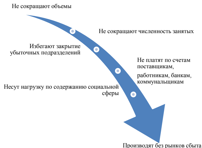
Рис. 3.2. Поведение предприятий в целях сохранения объемов производства

Несмотря на определенный прогресс, правительство не смогло проводить последовательную политику «шоковой терапии» и строгую монетарную политику из-за стремления спасти крупные предприятия, ставшие банкротами в новых хозяйственных условиях. Пытаясь восстановить прежние объемы и предоставить льготные кредиты предприятиям, оно оказывало все большее давление на банки с тем, чтобы заставить их предоставлять льготные кредиты предприятиям. В результате выданных под политическим давлением невозвратных кредитов обанкротились Агропромбанк, Эльбанк, Дыйканбанк, Внешэкономбанк. В кризисном положении оказались АКБ «Кыргызстан» и Промстройбанк. В сентябре и октябре 1993 г. инфляция снова подскочила до уровня свыше 30% в месяц. Сом начал быстро обесцениваться. Кыргызстан оказался на пороге гиперинфляции и краха только что введенной валюты [48, 66].