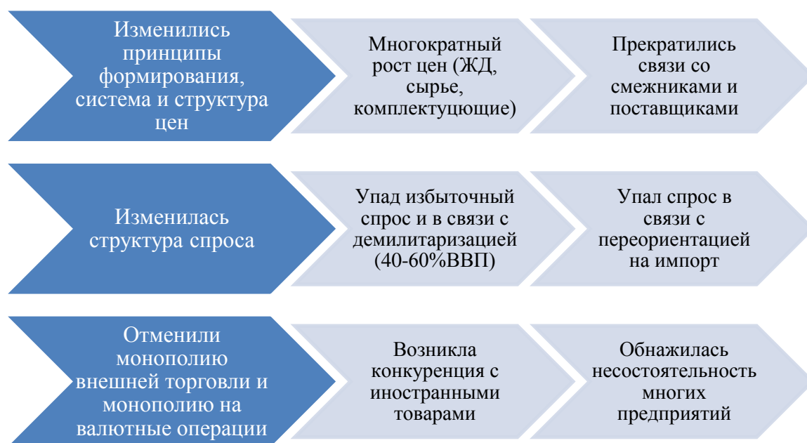
Рисунок 3.1. Изменения экономических условий в связи с развалом СССР и переходом к рынку

запустить механизмы спроса и предложения [86, 94, 128, 141]. В результате либерализации цен значительно, в сотни и тысячи раз выросли цены на импортируемое Кыргызстаном сырье (металлы, лес, химикаты), энергоносители (газ, нефть), транспортные тарифы. Это привело к резкому росту себестоимости продукции предприятий [56, 76, 94]. Обнажились все проблемы иррациональных принципов размещения промышленности: удаленность от основных поставщиков сырья и основных рынков сбыта, ориентированность на привозные сырье и комплектующие, неконкурентоспособность продукции, высокая себестоимость [37]. Появилась проблема неплатежей как следствие неплатежеспособности предприятий, нерациональной структуры производства.