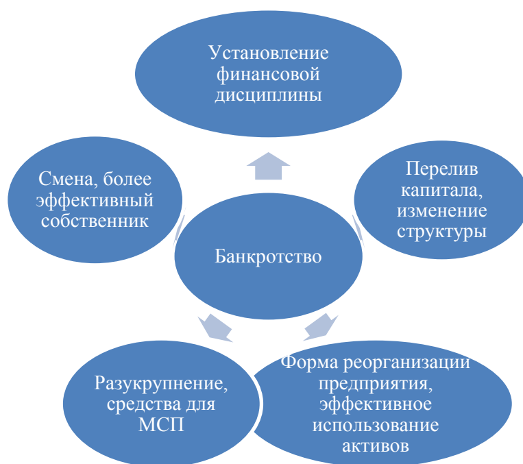
Рис. 4.1. Функции банкротства убыточных предприятий

годы в промышленности сохранялось большое число убыточных предприятий. Нужно иметь в виду, что процесс банкротства, не зависит от нашего желания или нежелания начать формальную процедуру банкротства. Если она не ведется в легальной форме, то происходит стихийно, в нелегальной форме. В этом случае имеет место незаконный процесс ликвидации предприятия под контролем собственников или директоров предприятий, вместо того, чтобы этот процесс шел под контролем назначенного собранием кредиторов ликвидатора. Это происходит либо в форме незаконной распродажи имущества, чему были многочисленные примеры, либо идет под руководством директоров предприятий в форме погашения задолженностей только отдельным кредиторам выборочно, по своему усмотрению. Фактически в 1990 годы интенсивно шел процесс банкротства, ликвидации, но вне рамок закона, а так, как его понимали дирекция предприятий и более предприимчивые кредиторы [38].