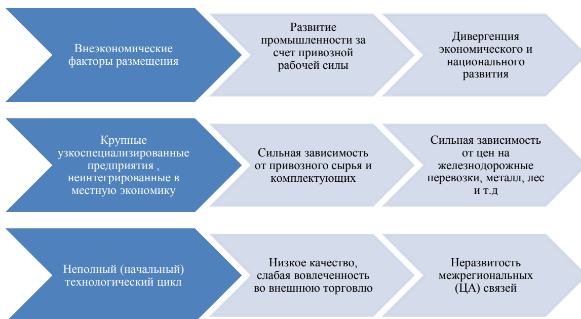
Рисунок 2.1. Особенности промышленности Кыргызской ССР

Промышленность Кыргызстана формировалась разными путями и под воздействием различных факторов, часто внеэкономических, что также сказалось на ее судьбе после крушения СССР (Рис. 2.1.). Многие крупные промышленные предприятия появились в Кыргызстане в связи с чрезвычайными условиями военного времени. В годы Второй мировой войны с июля по ноябрь 1941 года из западных и центральных областей СССР в Кыргызстан было эвакуировано более 30 крупных заводов, фабрик и мастерских. В этих условиях было не до расчетов экономической целесообразности перемещения этих производств на окраину Союза. Но и в послевоенный период некоторые предприятия были размещены в Кыргызстане вынуждено, без учета экономической целесообразности. Так, например, на месте бывших урановых разработок с целью занять имеющиеся трудовые ресурсы были построены Майлуу-Суйский электроламповый завод, Минкушский завод Оргтехники и Каджи-Сайский электротехнический завод. В связи с этим, такие крупные предприятия были построены в горной местности, вдали даже от имеющихся железнодорожных путей.