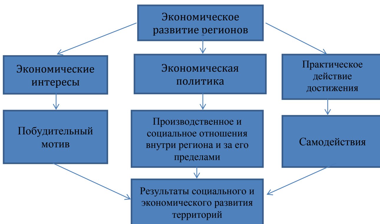
Рис. 1.1. Взаимодействие трех направлений экономического развития регионов.

При этом основной целью обеспечения эффективного использования экономических потенциалов регионов Кыргызстана, является реализация национальных интересов через формирование материальной основы успешного развития каждого села, района и города, всех областей республики. В этом контексте «экономические интересы – экономическая политика – практическая действия для достижения интересов» выступают как три стороны экономического развития регионов, включающие побудительный мотив, само действие, развитие и его конечный результат (рис.1.1).