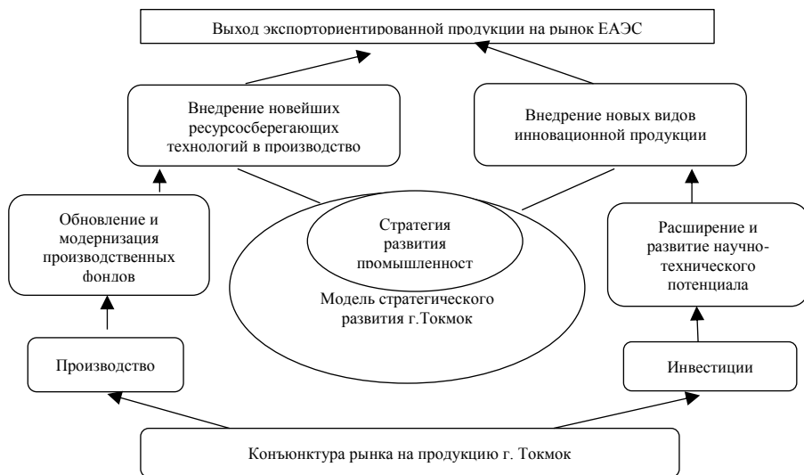
Рис.3.1. Стратегия промышленного развития г. Токмок