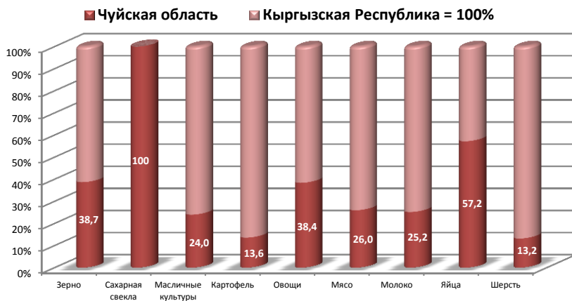
Рис. 2.2. Удельный вес Чуйской области в производстве основных видов продукции сельского хозяйства в 2015 г. в общем объеме Кыргызской Республики (%)

Однако внешняя торговля, в том числе в рамках ЕАЭС, зависит не от валовых показателей, а от конкурентоспособности продукции на внешнем рынке и объема экспорта продукции. В свою очередь внешнюю торговлю характеризует также импорт товаров и услуг, в том числе из стран ЕАЭС.