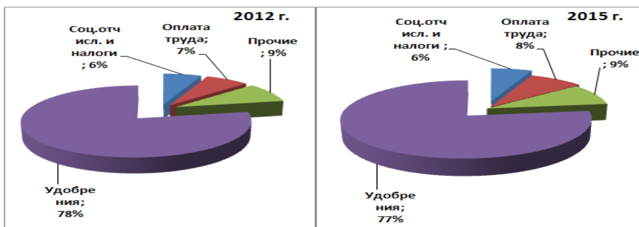
б) Затраты на производство риса