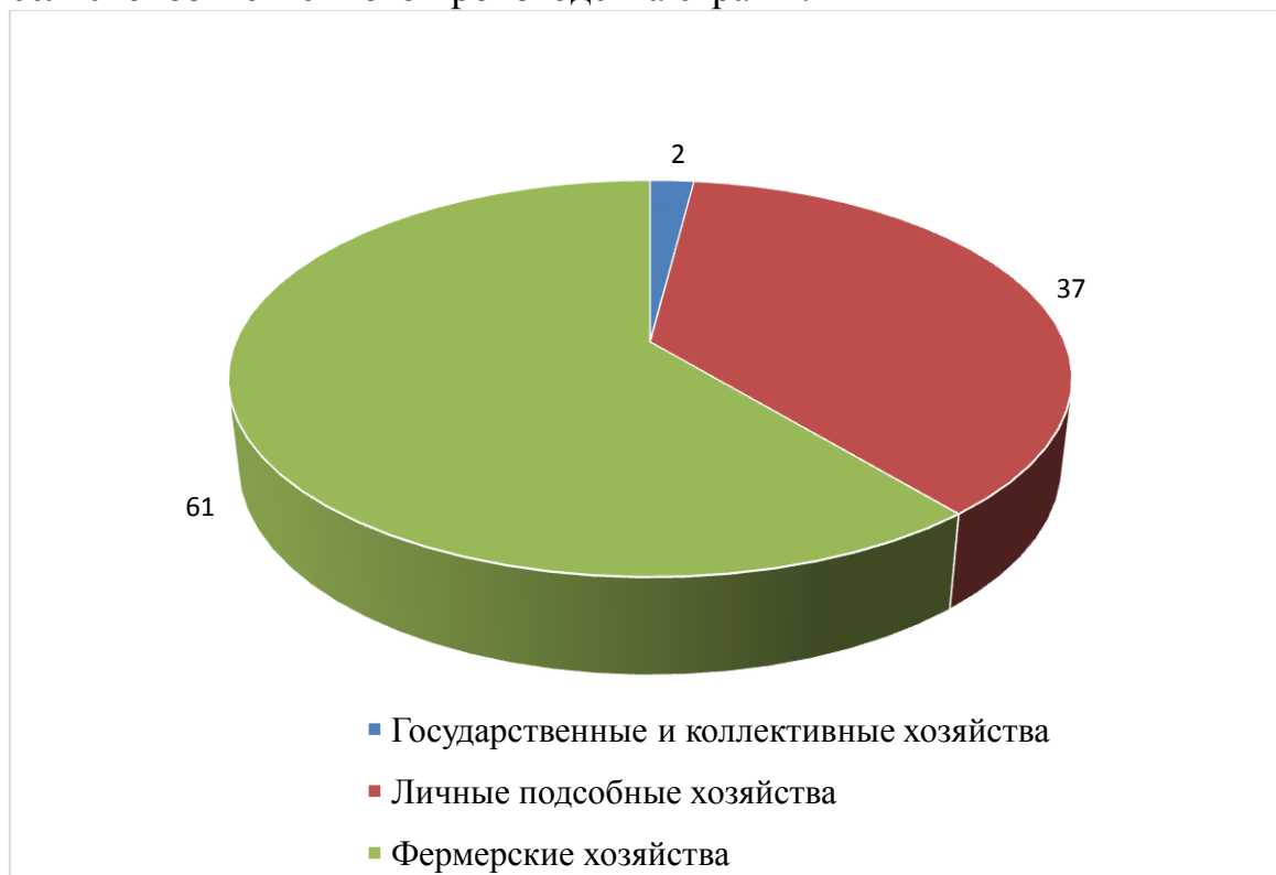
Рис. 3.1. Структура валового выпуска продукции сельского хозяйства по категориям хозяйств в 2015 г. (%)

насколько эффективно они будут работать, зависит будущее сельскохозяйственного производства страны.