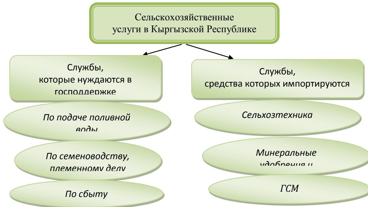
Рис. 2.1. Структура сельскохозяйственных услуг в Кыргызской Республике

предоставляющих сельскохозяйственные услуги, должны учитывать сложившуюся их структуру и реальное экономическое положение получателей услуг. Результаты исследования состояния доступа сельских товаропроизводителей к сельскохозяйственным ресурсам и услугам позволили провести институциональный анализ функционирования сельскохозяйственных служб по следующим условным группам (рис. 2.1).