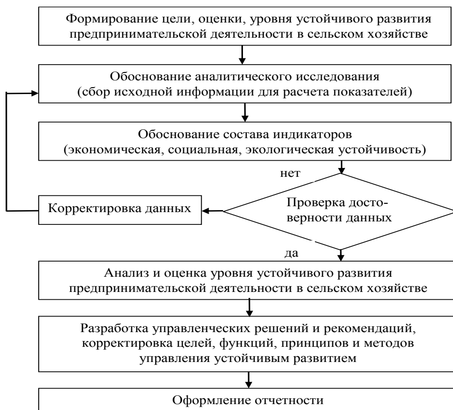
Рис. 2.1 - Методика оценки уровня устойчивого развития предпринимательской деятельности в сельском хозяйстве