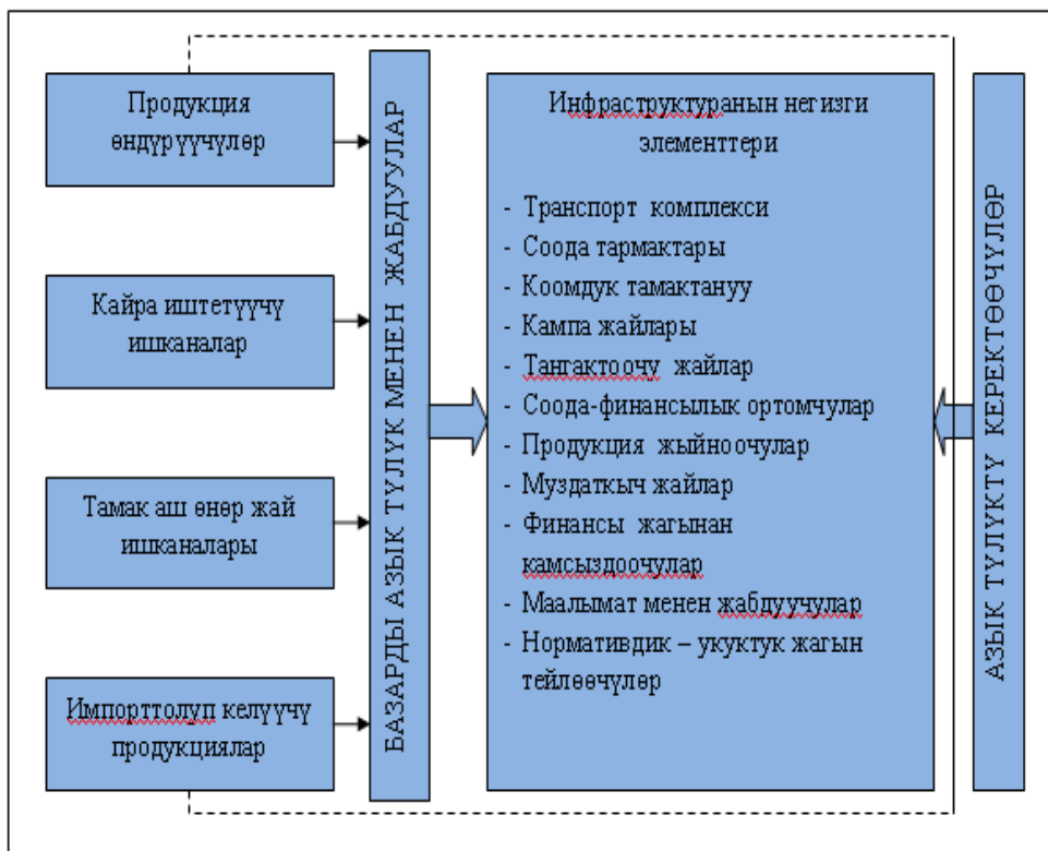
2-сүрөт. Азык-түлүк базар инфраструктурасынын иштөө тилкеси

эми функциялык жактан маалыматтык, финансылык жана укуктук-ченемдик камсыздоо жагы камтылат (2-сүрөт).