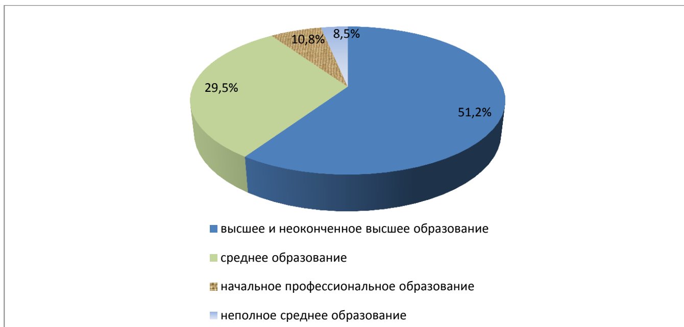
Рис. 2. Классификация опрошенных респондентов по образованию