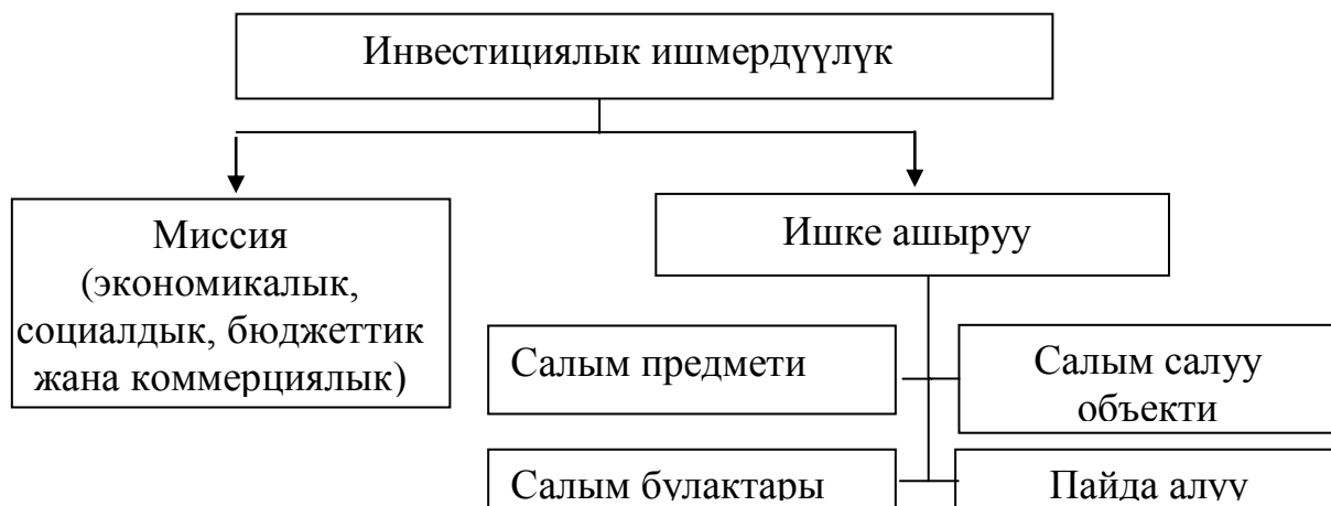
1-сүрөт. Инвестициялык ишмердүүлүктүн схемасы

Инвестициялоонун түпкү максаты инвестициялык ишмердүүлүктүн миссиясынан (максатынан) жана ишке ашыруусунан келип чыгат. Өз кезегинде ишке ашыруу бир тараптан салымдардын предметин жана булактарын аныктоону шарттаса, экинчи тараптан салым салуу объекттерин жана алынуучу пайданы шарттайт (1-сүрөт).