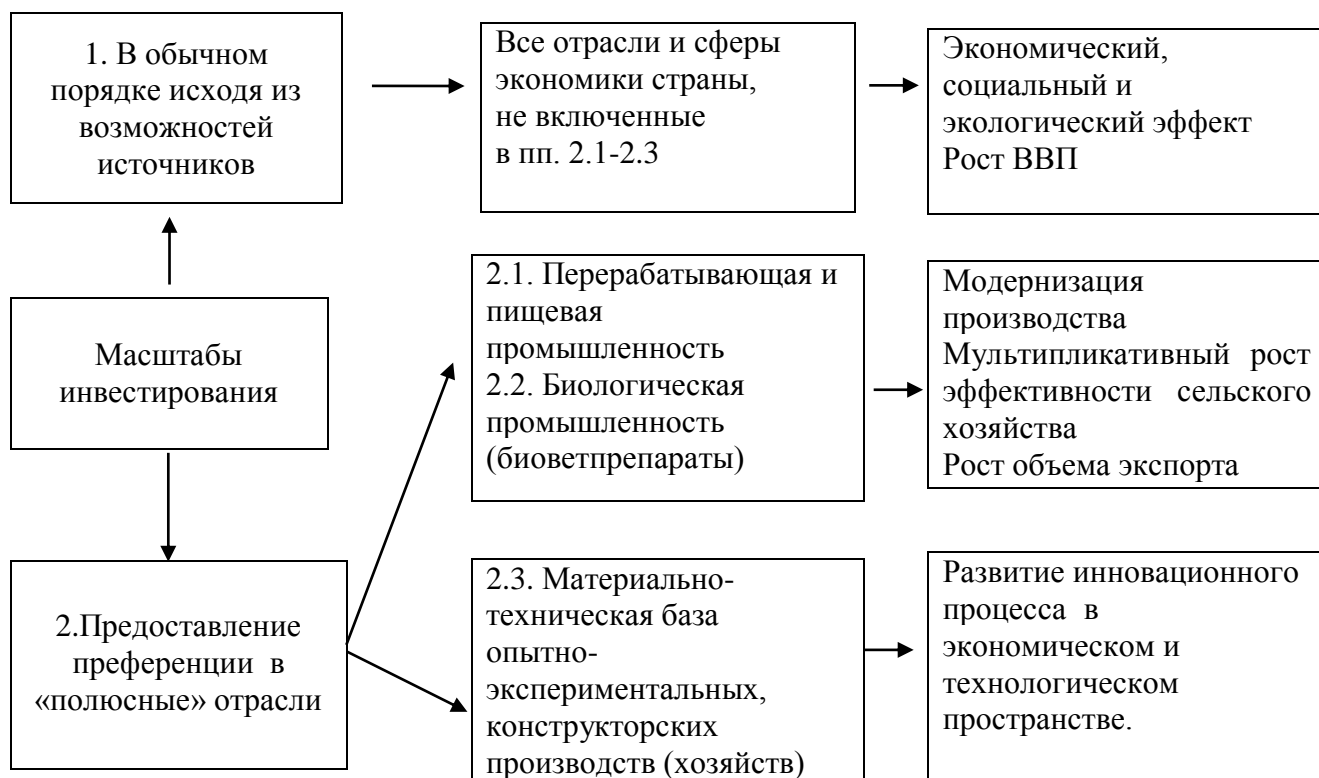
Рис. 3. Модель регулирования направлений инвестиций по отраслям экономики