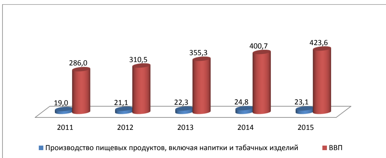
Рис.3 Производство пищевых продуктов и ВВП по годам (млрд. сом)

Вместе с тем, наблюдается снижение производства в пищевой промышленности за 2015 г. (рис. 3).