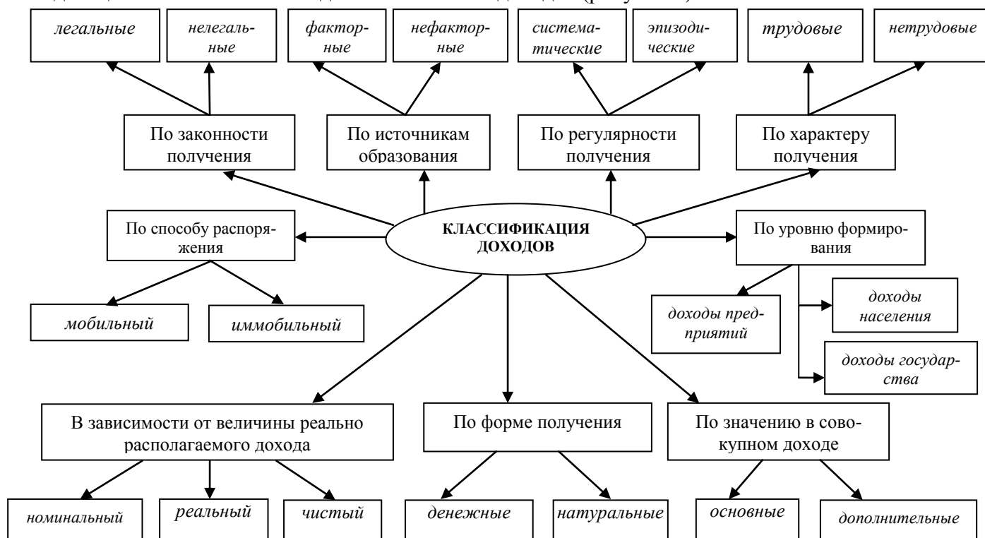
Рисунок 1. Классификация доходов населения 1

В диссертации автором на основе предложенных подходов и методов к классификации доходов населения разработана и предлагается детальная классификация доходов населения, дающая возможность исследовать источники доходов (рисунок 1).