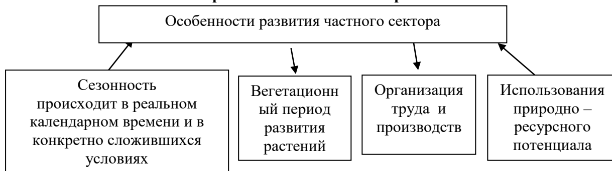
Схема.1 Особенности развития частного сектора в сельском хозяйстве

Данная схема свидетельствует о том, что особенностям развития частного сектора в сельском хозяйстве является сезонность, вегетационный период развитие растений, организация труда и производств и использования природно-трудовых ресурсов и т.д. Совершенствуется внутривладельческий механизм в сельскохозяйственных кооперативах, выводятся убыточных и низко рентабельных хозяйств, в результате чего часть убыточных хозяйств расформировываются и создаются самостоятельные дехканские (фермерские) хозяйства, рассматривается вопрос выделения земель дехканским хозяйствам для производства продукции.