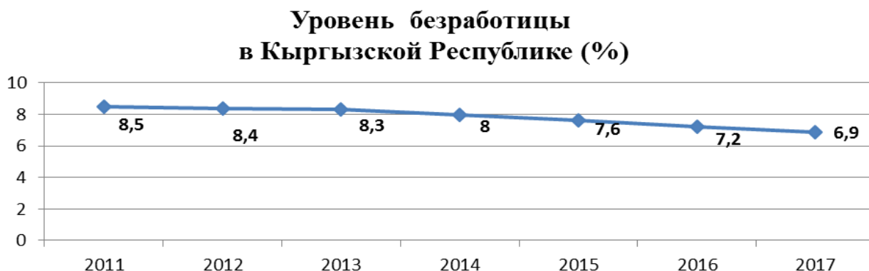
Рис.2 – Уровень безработицы в Кыргызской Республике, (%)

Если говорить об уровне безработицы, рассчитанной по методологии МОТ, то в 2017 г. он составил 6,9%, что ниже уровня 2011 г., равного 8,5%. В целом за указанный период происходит ежегодное снижение уровня безработицы, что отражает улучшение в экономике Кыргызстана (рис.2).