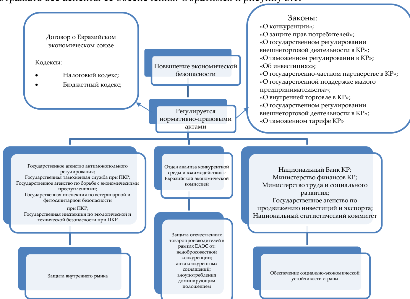
Рис. 3.1. Организационно-экономический механизм экономической безопасности КР Разработано автором

Поэтому, по мнению автора диссертационного исследования необходимо разработать механизм повышения экономической безопасности, который будет отражать все аспекты ее обеспечения. Обратимся к рисунку 3.1.