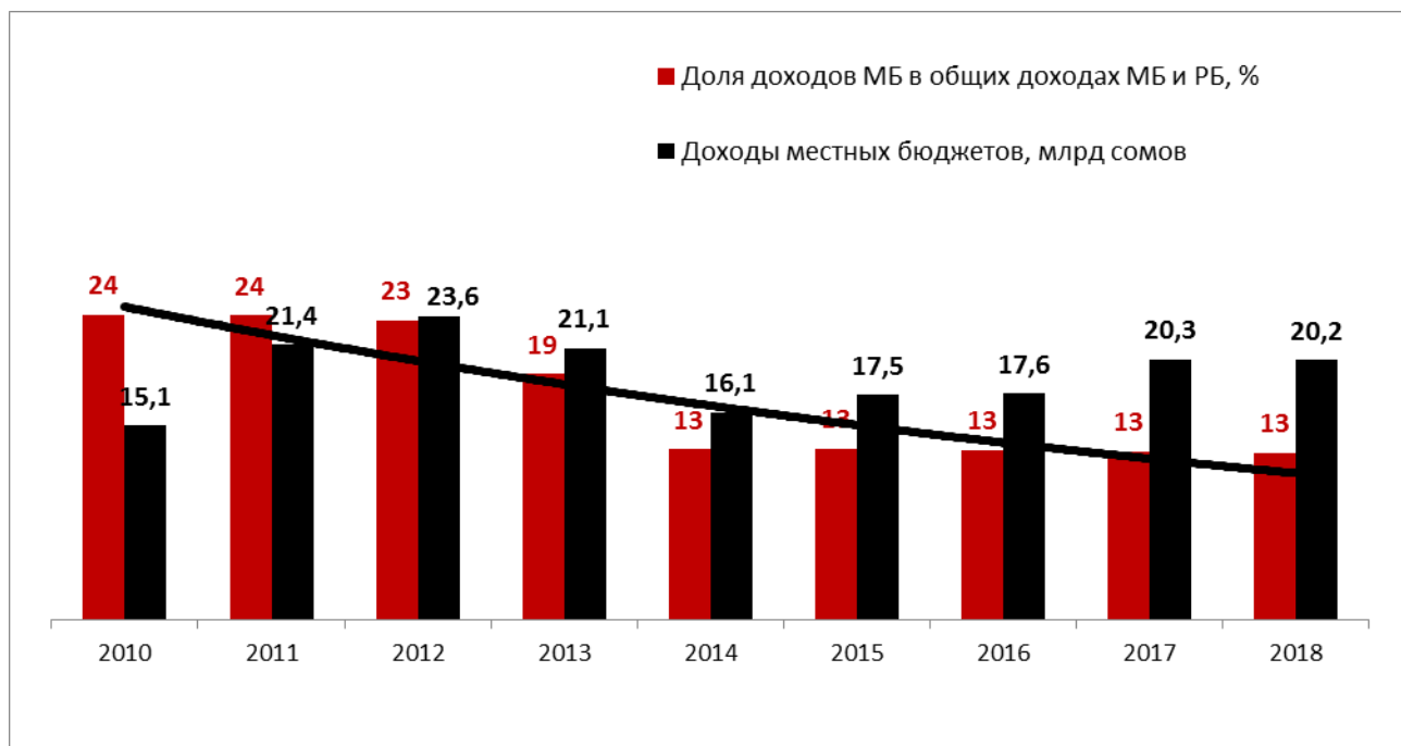
Рис. 3.1. Динамика доходов местных бюджетов, 2010-2018 гг.

Если рассмотреть соотношения доходов местного бюджета в общих доходах республиканского бюджета, то анализ показывает, что оно имеет тенденцию к постоянному сокращению, о чем свидетельствуют данные следующих рисунков.