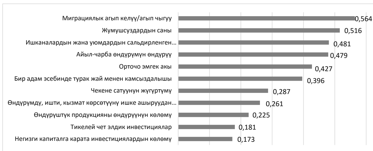
2-сүрөт. 2009-2018-жж. экономикалык өнүгүүнүн негизги көрсөткүчтөрү боюнча Чүй областынын райондорунун интегралдык рейтингдеринин орточо мааниси [автор тарабынан эсептелген жана түзүлгөн]

Айыл чарба продукциясын өндүрүүнүн өсүүсүндөгү активдүүлүк олуттуу (көрсөткүчтүн рейтинги 0,479). Изилдөө мезгили үчүн орточо эмгек акы активдүү жогорулаган. Төмөн динамикалуу негизги капиталга инвестициялоо, тикелей чет элдик инвестициялар, өндүрүштүк продукцияны өндүрүүнүн көлөмү, продукцияны, ишти жана кызмат көрсөтүүлөрдү ишке ашыруудан дүң киреше, ошондой эле чекене сатуунун айлануусу сыяктуу көрсөткүчтөр болду.