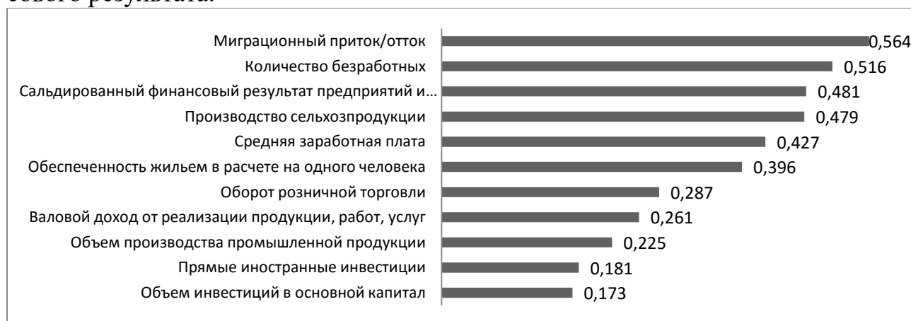
Рис. 2.2. Среднее значение интегральных рейтингов районов Чуйской области по основным показателям экономического развития в 2009-2018гг. [рассчитано и составлено автором]

Наибольшей динамики в развитии районы Чуйской области добились в снижении миграционного оттока (рейтинг показателя оставил 0,564), а также в вопросе снижения уровня безработицы в области (рейтинг показателя – 0,516). Отмечены хорошие достижения в вопросе повышения сальдированного финансового результата.