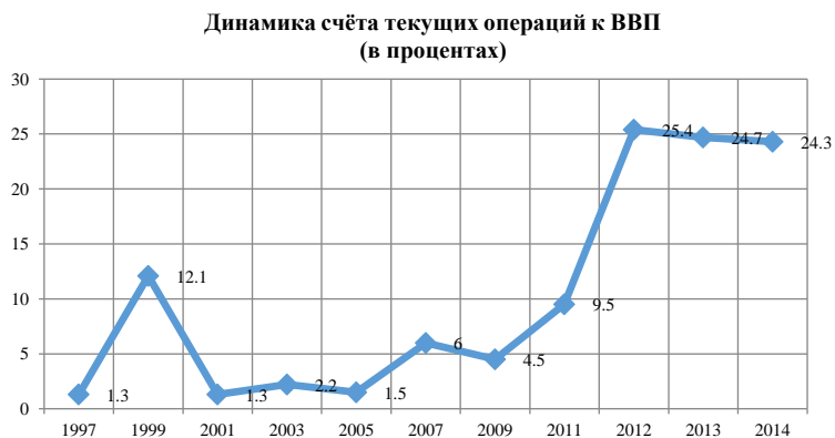
Рис. 2. Динамика текущего счёта к ВВП (в процентах)

Составлено автором на основании данных НБ КР, НСК.