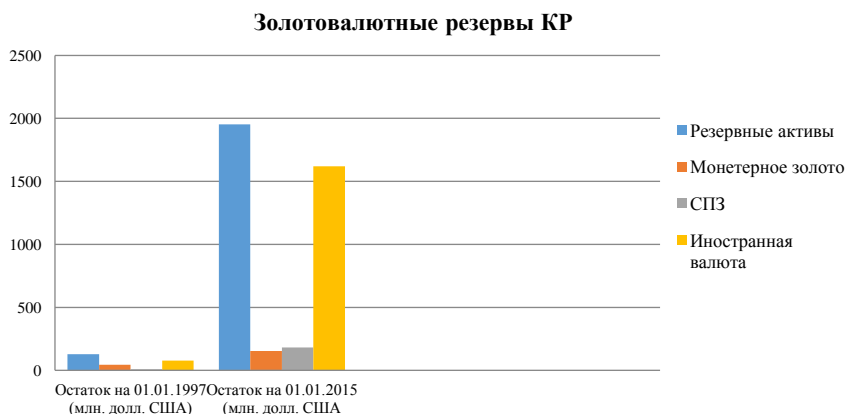
Рис. 4. Сравнительные показатели золотовалютных резервов Кыргызской Республики за 1997 и 2014 гг.

Рост иностранных резервов является однозначно позитивным явлением, поскольку создает уверенность в способности центрального банка сбивать резкие изменения обменного курса и создает «подушку» на случай кризисных проявлений.