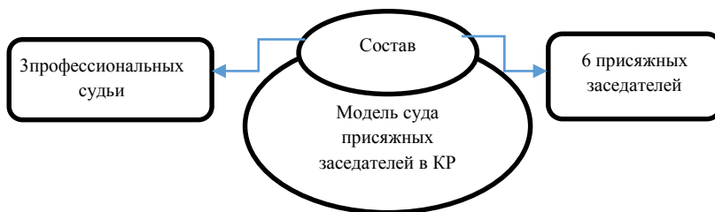
Рис. 2.1. Модель состава суда присяжных заседателей в КР.

Исходя из толкования положений нового УПК КР ч.3 статьи 28, ст. 263 УПК КР, дела по обвинению лиц в совершении уголовных преступлений рассматриваются межрайонным судом в качестве суда первой инстанции с участием присяжных заседателей и под председательством профессионального судьи. По мнению автора, необходимость функционирования института присяжных заседателей обусловлена важностью совершенствования, действующей в Кыргызской Республике модели суда присяжных заседателей. Для более объективного исследования уголовных дел и защиты прав, свобод и законных интересов обвиняемого, следует закрепить в законодательном порядке разбирательство таких категорий дел, за которые последнему может грозить пожизненное заключение, в составе коллегии из трех судей и шестерых присяжных заседателя (рис.2.1.).