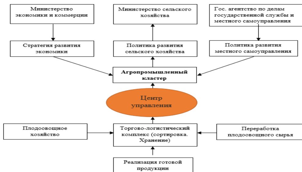
Рисунок 3.1. Модель организационной структуры агропромышленного кластера

На основание положительного анализа развития экономики Баткенской области предложена модель организационный структуры на примере потенциального агропромышленного кластера в Баткенской области (рисунок 3.1).