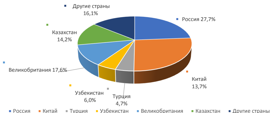
Рисунок 2.1 Удельный вес отдельных стран в общем объеме товарооборота Кыргызской Республики в 2020 году (в % к общему объему товарооборота)