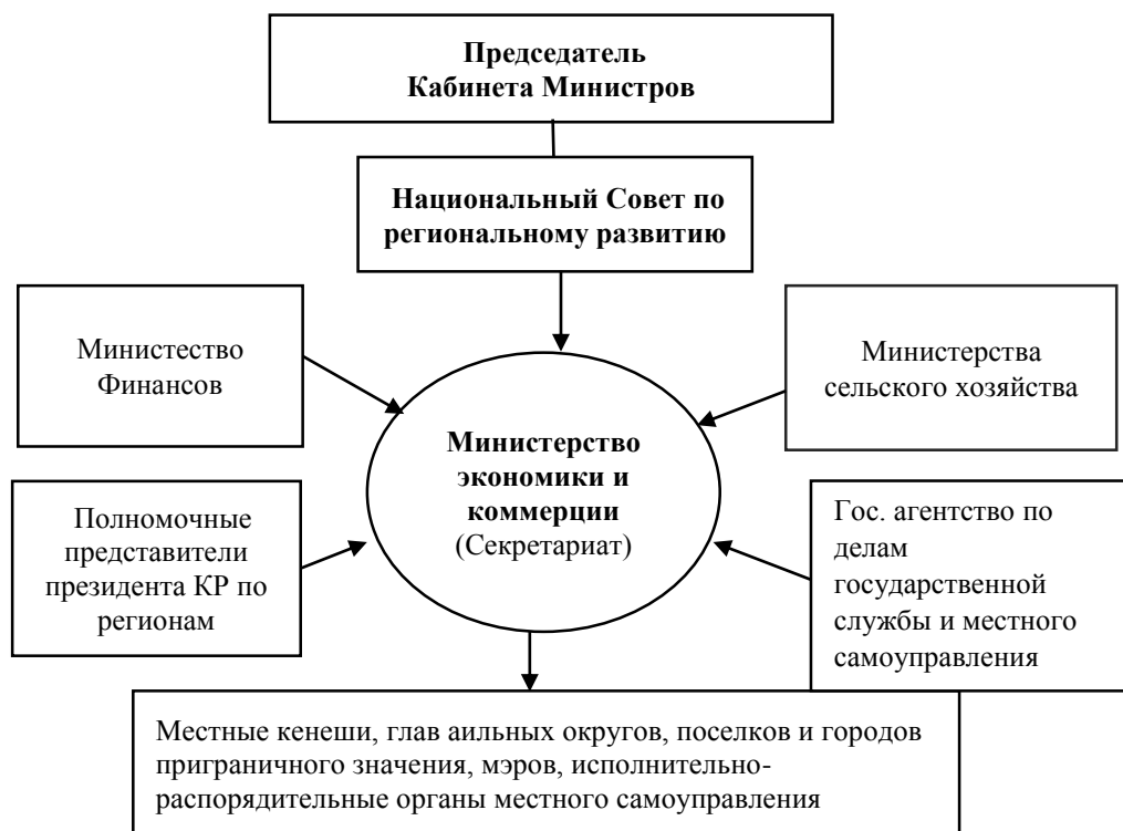
Рисунок 3.2. Предлагаемая модель Национального Совета по региональному развитию Кыргызской Республики

региональную политику страны. Данный государственный орган в соответствии со своими функциями обязан тесно взаимодействовать с региональными органами управления. Для усиления статуса Совета его председателем может стать Председатель кабинета Министров страны (рисунок 3.2).