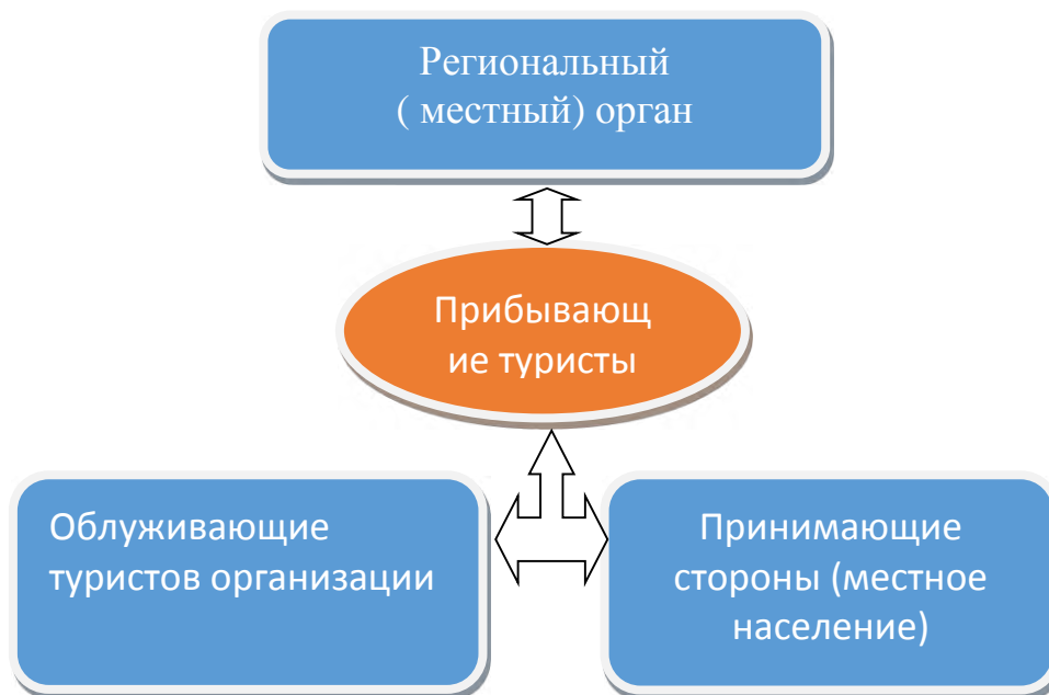
Рисунок 1.1. Структуры коммуникации с туристами, приезжающими в регион

соответствующими ресурсами. Положительный результат взаимодействия с приезжими туристами, в том числе отдыхающими из другой страны, имеет первостепенное значение для принимающей группы (рис. 1.1).