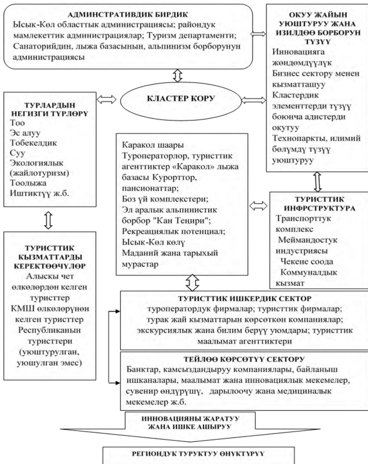
3.1 – сүрөт. Ысык-Көл регионундагы “Каракол” туристтик кластеринин келечектеги модели