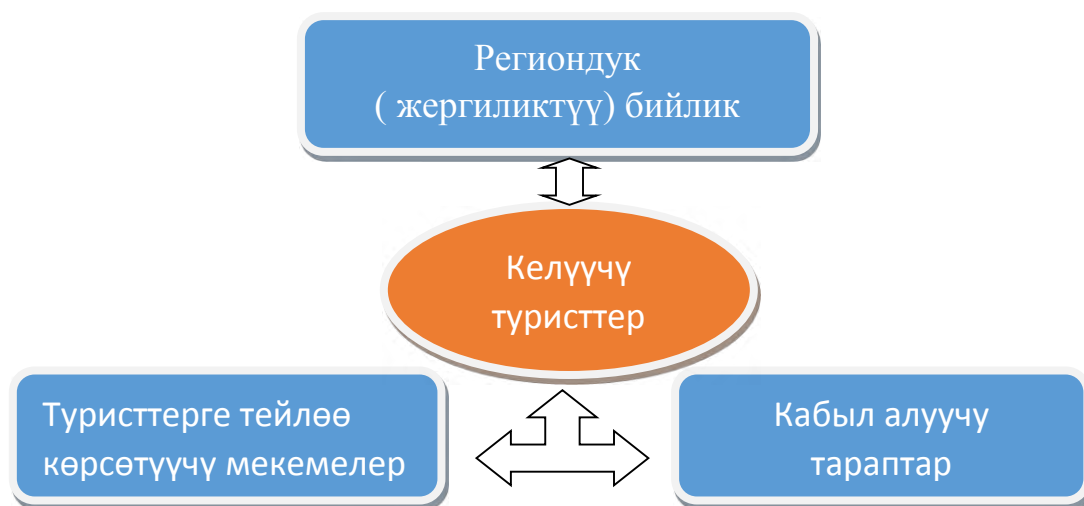
1.1-сүрөт. Регионго келүүчү туристтер менен алака түзүүчү түзү

Региондук туризмди өнүктүрүү эң алды менен жергиликтүү калкты иш жана тиешелүү каражат жагынан камсыз болуунун олуттуу фактору катары каралат. Келген туристтер, анын ичинде чет мамлекеттен эс алгандар менен өз ара аракеттенүүнүн алгылыктуу жыйынтыкталышы кабыл алуучу катары аракеттенген топ үчүн эң маанилүү болуп саналат (1.1-сүрөт).