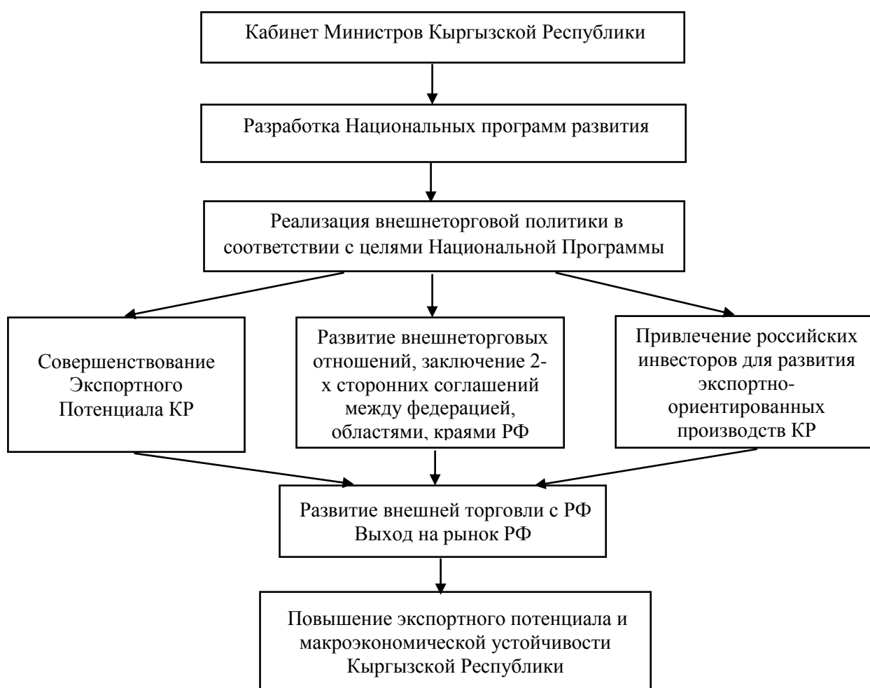
Рисунок 3.2. Модель развития внешнеторговых отношений с Российской Федерацией

Внешнеторговые отношения могут развиваться не только в рамках ЕАЭС, но и в рамках отдельных межгосударственных отношений. Такой механизм позволяет проводить работу по реализации внешнеторговой политики более системно, целенаправленно и точно в соответствии с разработанной Дорожной Картой на перспективу (рисунок 3.2). Таким образом, предложенные экспортноориентированная модель и модель развития внешнеторговых отношений с Россией позволят в дальнейшем Кабинету министров КР разработать определенный план действий по повышению экспортного потенциала республики, внедрить логистическо - интегрированные структуры в экспортные отрасли.