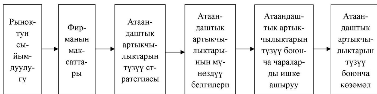
4.1-сүрөт. Агрардык сектордо атаандаштык артыкчылыктарынын стратегиясын иштеп чыгуунун этаптары

Агроөнөр жай өндүрүшүнүн натыйжалуулугуна жетишүү айыл чарба тармагында гана эмес, ошондой эле айыл чарба иш-аракеттери киргизилгенге чейин жана андан кийин анын чегинен тышкары дагы узак убакытты жана биргелешкен иш-аракеттерди талап кылары анык. Бул өз кезегинде стратегиялык максаттарды иштеп чыгууну талап кылат. Биз стратегияны компаниянын мүмкүнчүлүктөрүн анализдөө, максаттарды тандоо, пландарды иштеп чыгуу жана түзүү, ошондой эле, иш-аракеттердин ар бир чөйрөсүндө атаандаштык артыкчылыктарын түзүү боюнча чараларды ишке ашыруу процесси деп түшүнөбүз. Бул процессти чийме түрүндө төмөнкүдөй чагылдырууга болот (4.1-сүрөт):