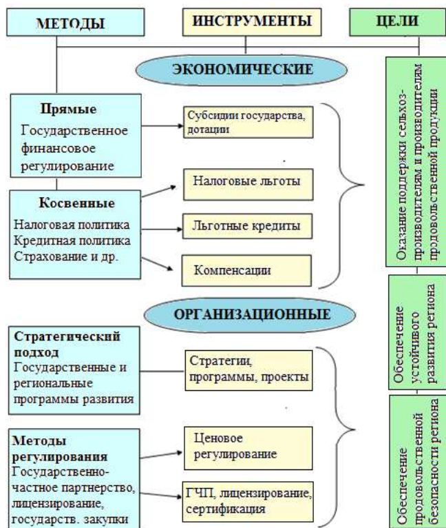
Рисунок 3.2. Организационно-экономический механизм обеспечения продовольственной безопасности региона