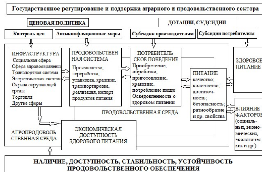
Рисунок 3.1. Модель обеспечения продовольственной безопасности населения на базе поддержки агропродовольственного сектора

Модель предполагает достижение цели обеспечения продовольственной безопасности в результате осуществления мер политики поддержки агропродовольственного сектора, в частности, ценовых стимулов, контроля цен, бюджетных субсидий и политики государства в области развития АПК.