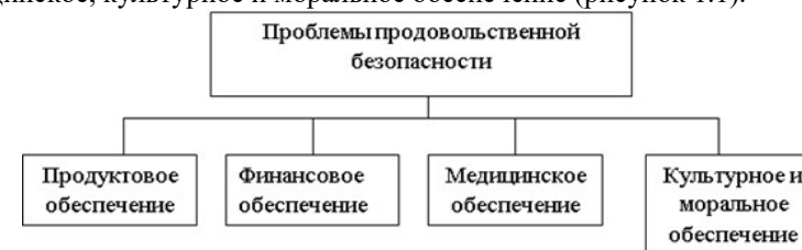
Рисунок 1.1. Архитектура продовольственной проблемы отдельного индивида

Мы считаем, что продовольственная безопасность, по крайней мере, должна учитывать четыре блока проблем: продуктовое, финансовое, медицинское, культурное и моральное обеспечение (рисунок 1.1).