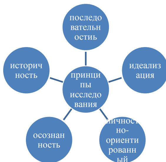
Рисунок 2.1. Принципы исследования эпоса «Манас» как этнопедагогического феномена.