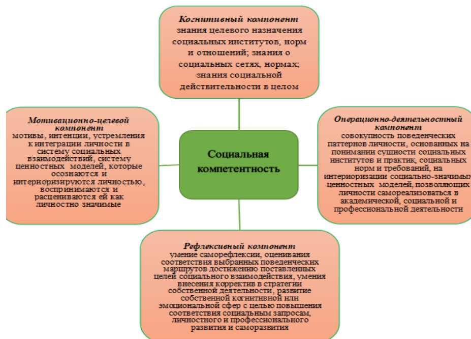
Рисунок 1.2. Структура социальной компетентности

На основании проведенного нами анализа, социальная компетентность представляет сложный интегральный конструкт, совокупность знаний, умений, навыков, интенций; мотивов личности, которые обеспечивают активное вовлечение индивидуума в систему социальных взаимодействий, его самореализацию в социальном контексте на основании знания социальных норм и требований, особенностей социального устройства, интериоризации в социально одобряемые аксиологические модели, а также выстраивания собственных поведенческих паттернов в соответствии с социальными нормами и социальными ценностями общества.