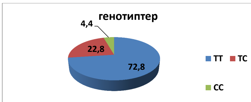
3.2-сүрөт – Жалпы топтун текшерилген бейтаптардын арасында эндотелийдик нитроксидсинтаза генинин генотиптеринин пайда болуу жыштыгы (%)

Текшерилген бейтаптардын арасында eNOS ген генотиптеринин өкүлчүлүгү ТТ генотиби үчүн 72,8%, ТС генотиби үчүн 22,8% жана СС генотиби үчүн 4,4% түздү. Генотиптердин байкалган таралышы Харди-Вайнберг тең салмактуулугунда болгон (3.2-сүрөт).