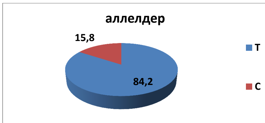
3.1-сүрөт – Жалпы топтун текшерилген бейтаптардын арасында эндотелийдик нитроксидсинтаза генинин аллельдеринин пайда болуу жыштыгы (%)

3.1-сүрөттө келтирилген маалыматтардан төмөнкүдөй, биз тарабынан алынган eNOS генинин аллелдерин бөлүштүрүү Т-аллелинин пайда болуу жыштыгынын олуттуу басымдуулугун көрсөтөт (Т-аллел - 84,2%, С-аллел - 15,8%).