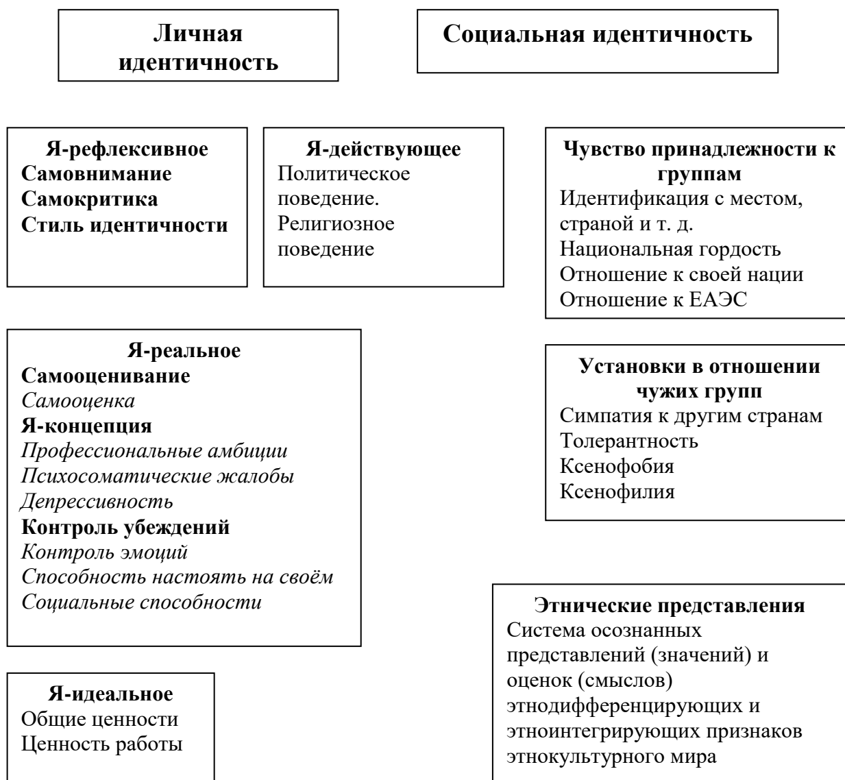
Рис. 4.4 Авторская структурная модель самопонимания личной и социальной идентичности в этнокультурных условиях

В заключение диссертационного исследования были сделаны следующие выводы: