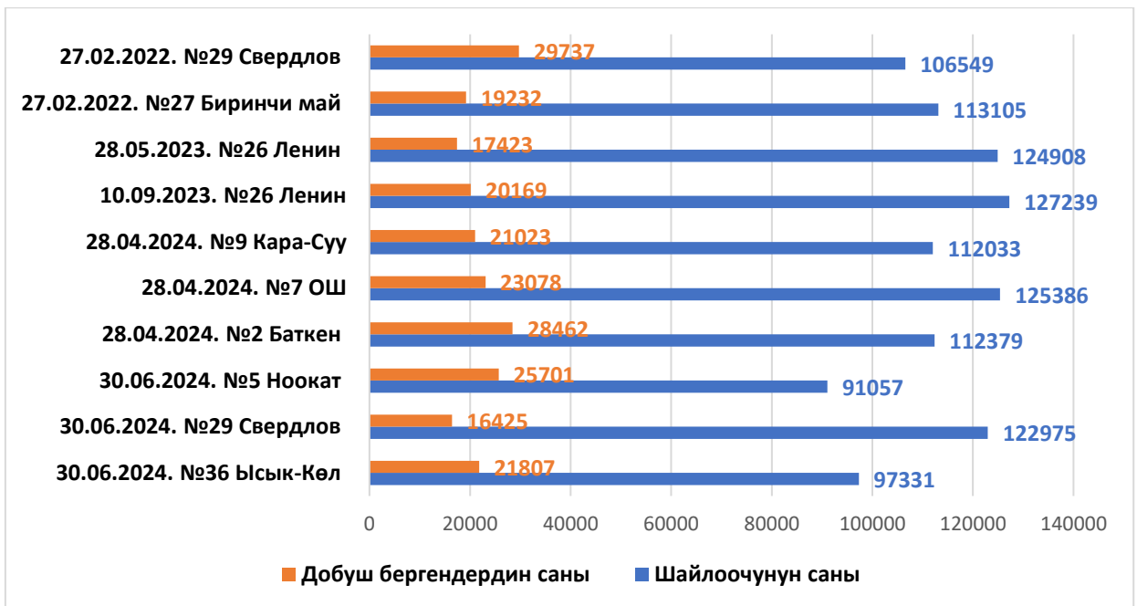
3.1 -сүрөт. 2021-жылдын 28-ноябрында өткөн КРнын ЖКнин бир мандаттуу шайлоо округдан шайланган депутаттардын мандаты бош калгандыгына байланыштуу кайра уюштурулган шайлоолордогу шайлоочунун саны менен добуш берген шайлоочунун санынын айырмачылыктары