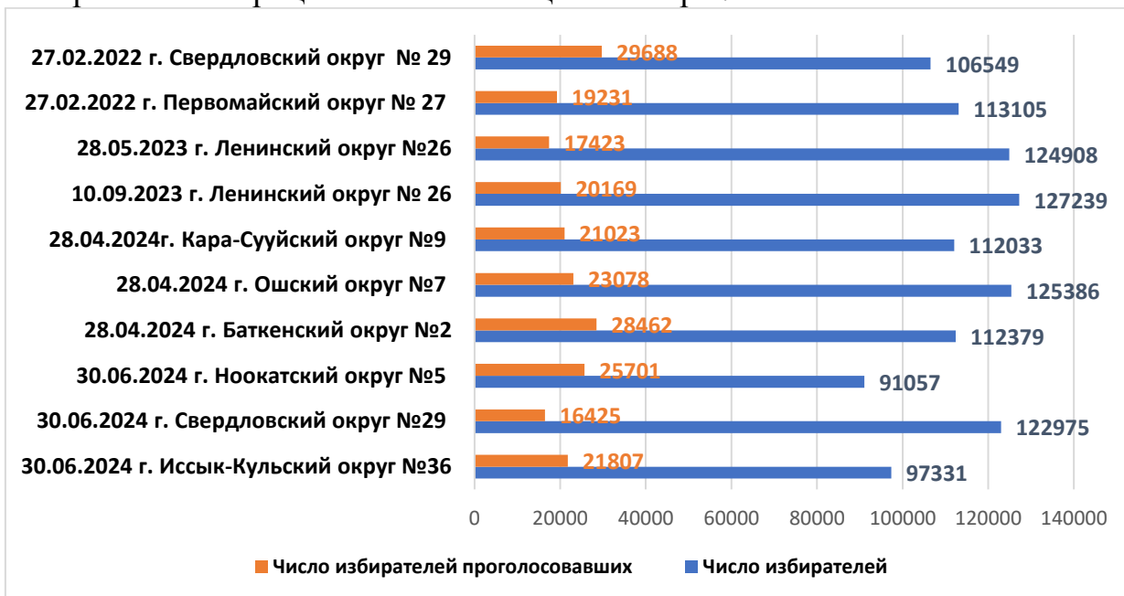
Рисунок 3.1. Цифры для сравнения: количество избирателей и их количество проголосовавших на повторных выборах по одномандатным округам.

После выборов депутатов ЖК КР 28 ноября 2021 года на основании нововведённых изменений в КЗ КР «О выборах Президента КР и депутатов ЖК КР» ст.59 п.7 который гласит: выборы депутатов ЖК по одномандатным избирательным округам вместо выбывших в соответствующих избирательных округах назначаются Президентом КР и проводятся ЦИК в течение двух месяцев после появления вакантного депутатского мандата в порядке, установленном конституционным законом, и в соответствии с вышеизложенной нормой, мы видим, что помимо ущерба в общереспубликанскому бюджету, приводит к тому, что избиратель устает от избирательных процессов и не посещает выборы.