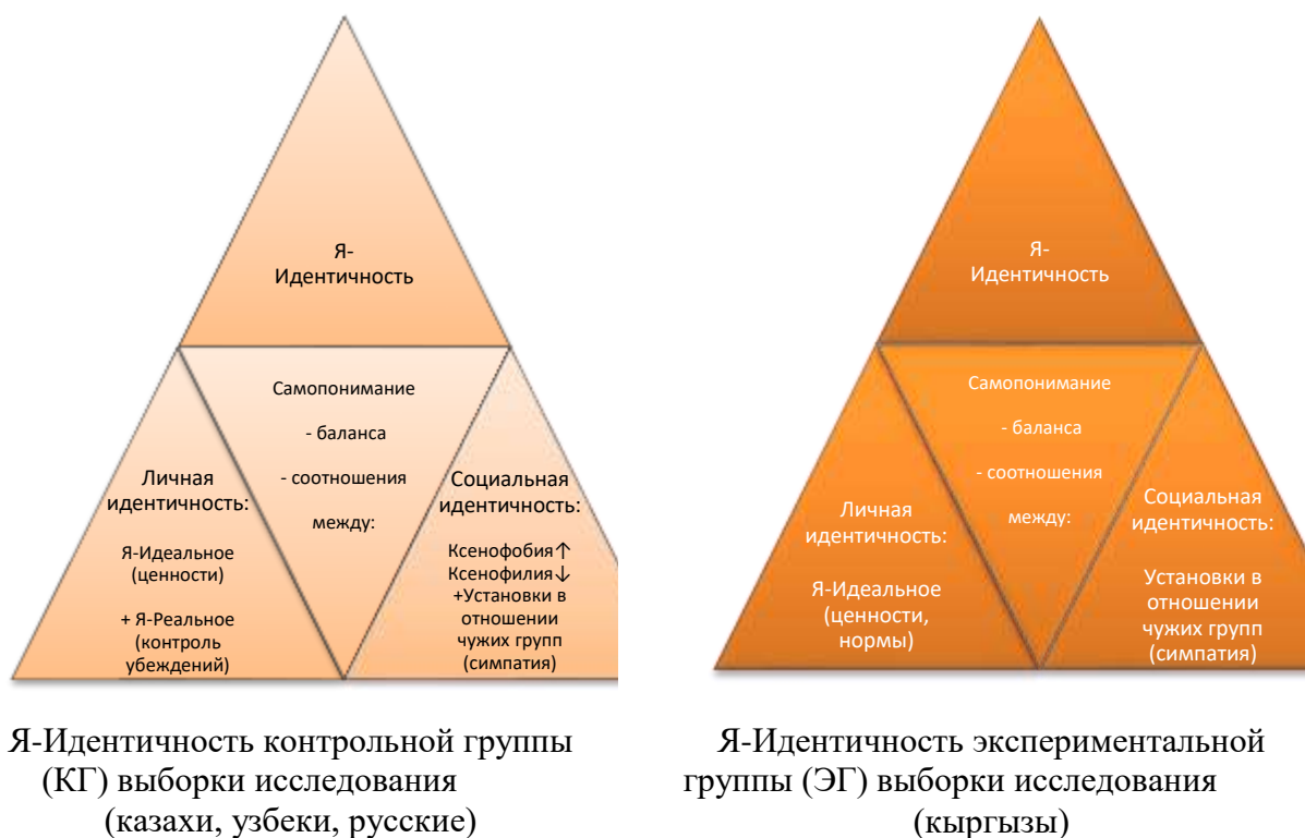
Рис. 3. Модель «Я-идентичность» экспериментальной и контрольной выборок исследования

перемен, военных конфликтов, именно самопонимание переживает новую стадию развития, когда подвергается проверке, переосмыслению соотношение личной и социальной идентичности, для дальнейшего развития Я-Идентичности, на новой основе осмыслении себя при ответе на вопрос: Кто Я. Представим различия соотношения самопонимания личной и социальной идентичности представителя кыргызского этноса с представителями других народов, проживающих в КР в виде Рис. 3: