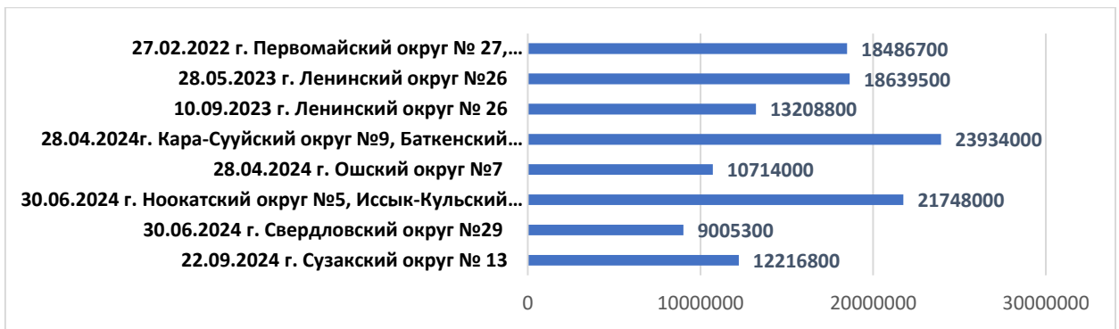
Рисунок 3.2. Цифры для сравнения: бюджет повторных выборов ЖК КР, прошедших 28 ноября 2021 года [Постановления ЦИК КР [Электронный ресурс]. – Режим доступа: https://shailoo.gov.kg/kg/npacik/Postanovleniya_CIK_KRBShKnyntoktomdoru/ – Загл. с экрана].