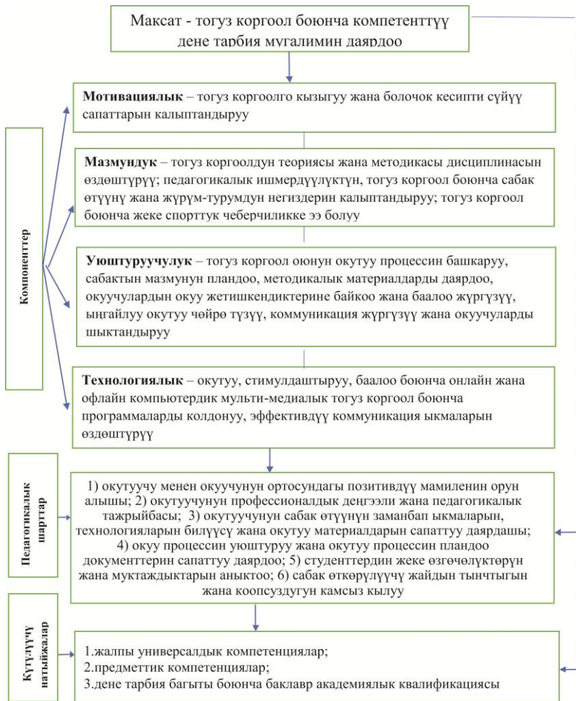
2.1-сүрөт. Болочок дене тарбия мугалимдерин даярдоодо тогуз коргоол боюнча кесиптик компетенттүүлүгүн калыптандыруунун теориялык модели.

Үчүнчү бап “Дене тарбия мугалимдерин тогуз коргоол боюнча адистик компетенттүүлүгүн калыптандыруу боюнча педагогикалык эксперименттин жүрүшү жана натыйжалары” деп аталып, болочок дене тарбия мугалимдерин тогуз коргоол боюнча адистик компетенттүүлүгүн калыптандыруу боюнча педагогикалык