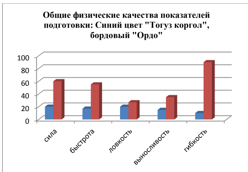
Рисунок 3.3. Диаграмма качественных показателей формирования общей физической подготовленности студентов (в%).