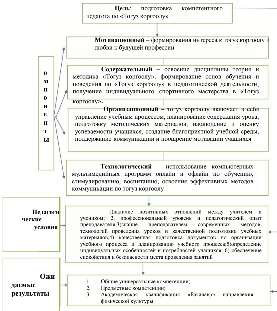
Рисунок 2.1. Теоретическая модель формирования профессиональной компетентности по «тогуз коргоол».

Разработана теоретическая модель формирования профессиональной компетентности по «тогуз коргоол» подготовки будущих учителей физической культуры (рисунок 2.1).