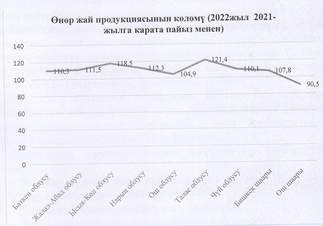
2-сүр. Өнөр жай продукциясынын көлөмү (2022 жыл 2021-жылга карата пайыз менен)

1-суретте көрсөтүлгөндөй 2022-ж. өнөр жай продукциясынын көлөмү 425 945,9 м.с. түздү. Ал эми ички дүң продукциялардын көлөмү 971 034,9 м.с.